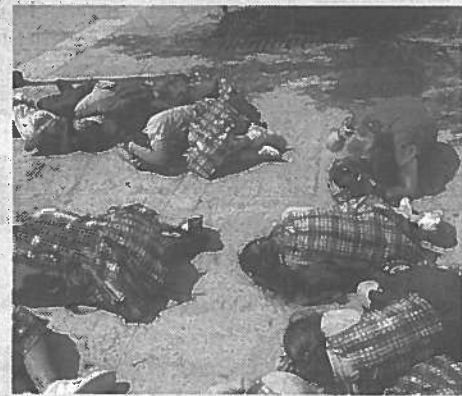
Estudiantes de la escuela elemental Alejandro Tapia y Rivera, de La Parguera, mientras participaban ayer de un simulacro organizado por la Red Sísmica de Puerto Rico.