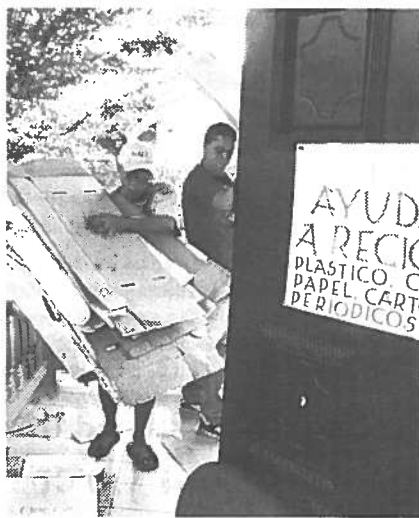
Voluntarios recogerán material reciclable como parte de un proyecto comunitario de AmeriCorps, que beneficiará al Hogar María del Carmen.